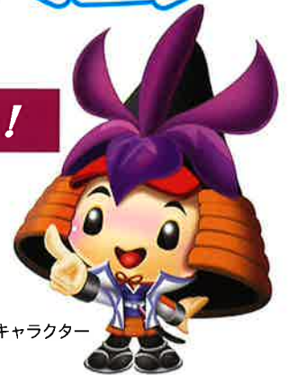
刈谷市マスコットキャラクター 「かつなりくん」